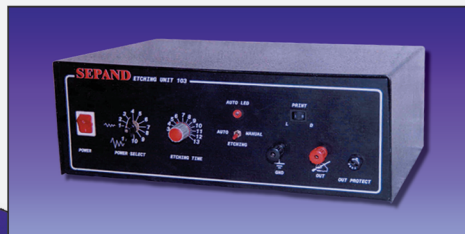
مدل ۱۰۵+، ۱۰۵، ۱۰۳، ۱۰۲